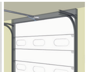
Installation moteur sur linteau