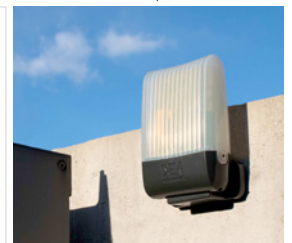
Lampe clignotante AURA