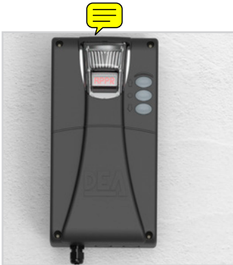
Armoire de commande murale avec boutons de fermeture/ouverture et lumière de courtoisie à LED