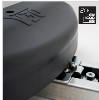
Contrôle du mouvement du moteur par encodeur à deux canaux qui garantit une précision et une sécurité maximales