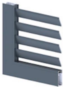
Lames persiennes ajourées à la française