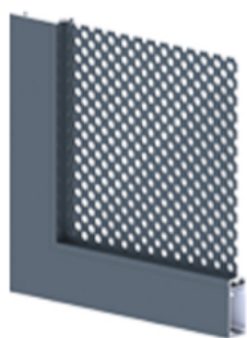
Tôle perforée (petit ronds R10T15 ou petits carrés C10U15)