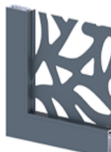
Tôle découpée motif Floral