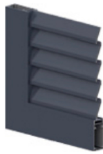
Lames persiennes ajourées à l'américaine orientables