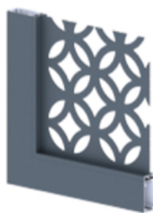
Tôle découpée motif Alcazar