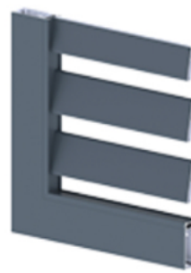
Lames américaine GIRASOL (droites ou inclinées)