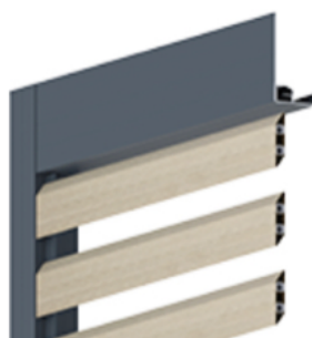
Lames PVC cosse de riz trapézoïdale et renfort alu