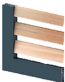
Lames persiennes ajourées à la française