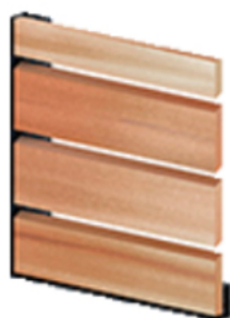
Medley lames ajourées