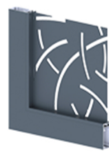
Tôle découpée motif Tiges