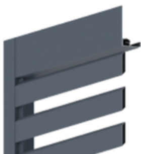
Lames alu trapézoïdales