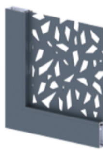
Tôle découpée motif Feuillage