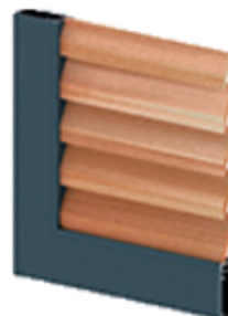
Lames américaine GIRASOL (droites ou inclinées)