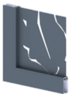
Tôle découpée motif Racines